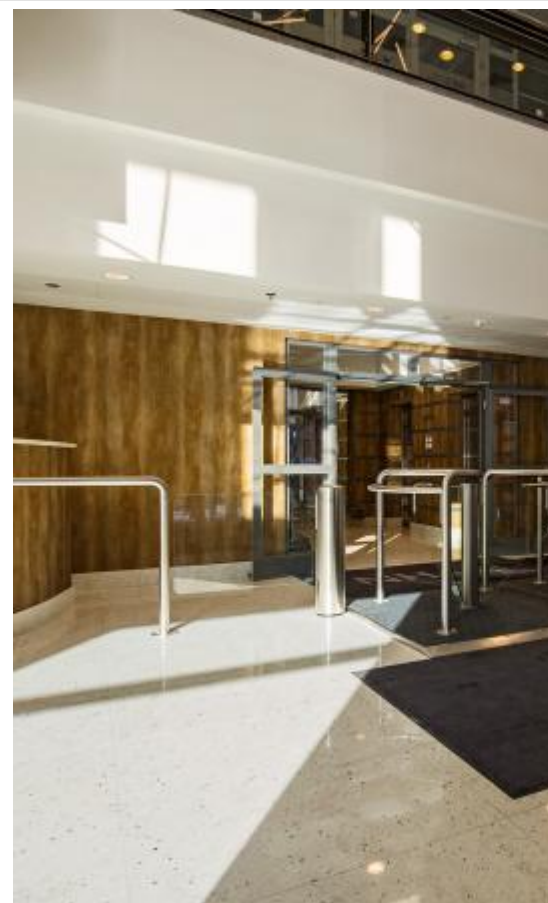
Kaskada Hall 1